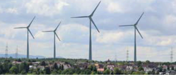
Aichwald, Ortsteil Aichschieß; Fotomontage: Windkraftanlagen mit Nabenhöhe 165 m, Rotordurchmesser 131 m, Gesamthöhe 230 m